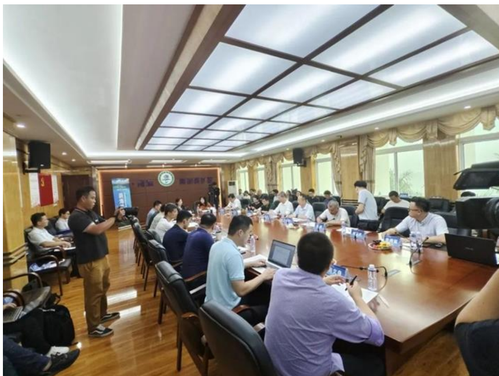
“海洋生态保护与修复”的自然保护公益沙龙现场